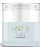
Vaso Airless 50 ml