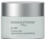
Vaso 50 ml