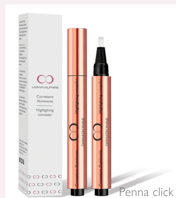
Penna click 3 ML

Gocce di fondotinta opacizzanti, rendono la pelle omogenea e luminosa, mantenendo un finish matt tutto il giorno. La sua texture si fonde perfettamente con la pelle, assicurando una coprenza modulabile e un risultato impeccabile!