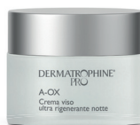
Vaso 50 ml