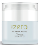
Vaso Airless 50 ml